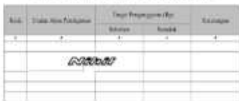
Tabel 3.2 Rincian Rencana Pelaksanaan Perubahan Peringkat Daerah Tahun 2014